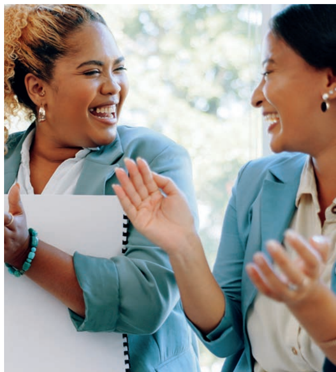
Entspannte Atmosphäre im Tante Emma Café

Dieses Angebot ist kostenfrei. Sie sind jederzeit willkommen!